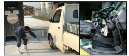
車両はタイヤだけでなく、 泥よけの内側まで消毒 し、 フロアマットの交換 や ペダル等車内も消毒