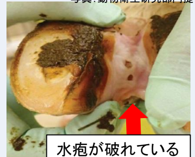
水疱が破れている

毎日必ず健康観察 し、これらの症状を見つけ次第、直ちに 獣医師 や 最寄りの家畜保健衛生所に連絡 しましょう。