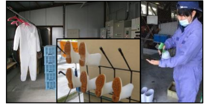
専用の服や靴の使用、手指消毒