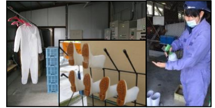
専用の服や靴の使用、手指消毒