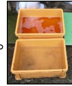
推奨される踏込消毒槽の設置方法！