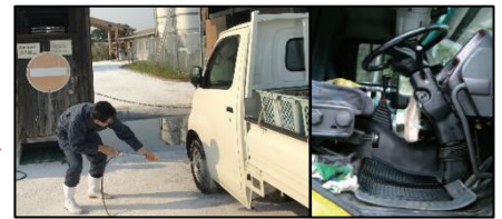
車両はタイヤだけでなく、 泥よけの内側まで消毒 し、 フロアマットの交換 や ペダル等車内も消毒